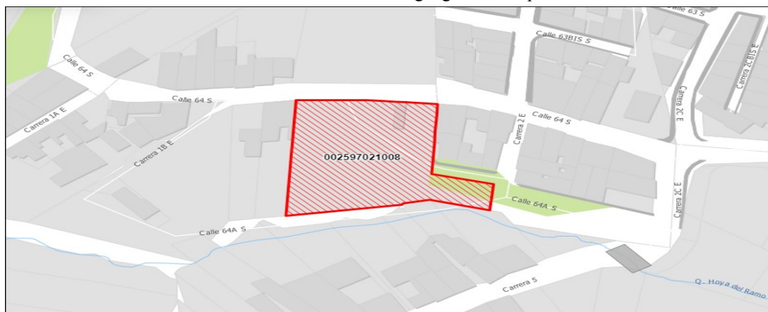
Plano No. 1. Ubicación geográfica del predio.